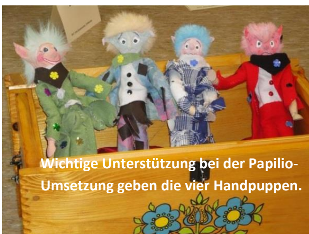
Wichtige Unterstützung bei der Papilio-Umsetzung geben die vier Handpuppen.

Kreativität und Experimentieren gibt es an diesem Tag (fast) ohne Grenzen, wenn es darum geht, alternative Spielideen umzusetzen. Ohne konventionelles Spielzeug mit anderen Kindern in Interaktion zu treten, ist dabei ein großer Lernschritt. Das pädagogische Team hat in diesem Zeitraum die Aufgabe, den Kindern die Initiative zum Spiel zu übergeben und dennoch gezielt Impulse zu setzen. Dieser Projekttag erfordert vom Personal besonders hohe Aufmerksamkeit und Sensibilität im Umgang mit den Bedürfnissen der einzelnen Kinder.