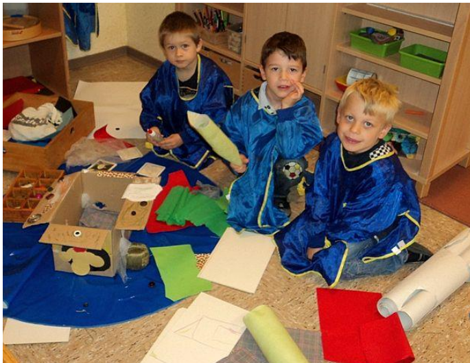
Spielzeug-macht-Ferien-Tag: Mit wenig Aufwand entstehen fantasievolle Verkleidungen.

Kreativität und Experimentieren gibt es an diesem Tag (fast) ohne Grenzen, wenn es darum geht, alternative Spielideen umzusetzen. Ohne konventionelles Spielzeug mit anderen Kindern in Interaktion zu treten, ist dabei ein großer Lernschritt. Das pädagogische Team hat in diesem Zeitraum die Aufgabe, den Kindern die Initiative zum Spiel zu übergeben und dennoch gezielt Impulse zu setzen. Dieser Projekttag erfordert vom Personal besonders hohe Aufmerksamkeit und Sensibilität im Umgang mit den Bedürfnissen der einzelnen Kinder.