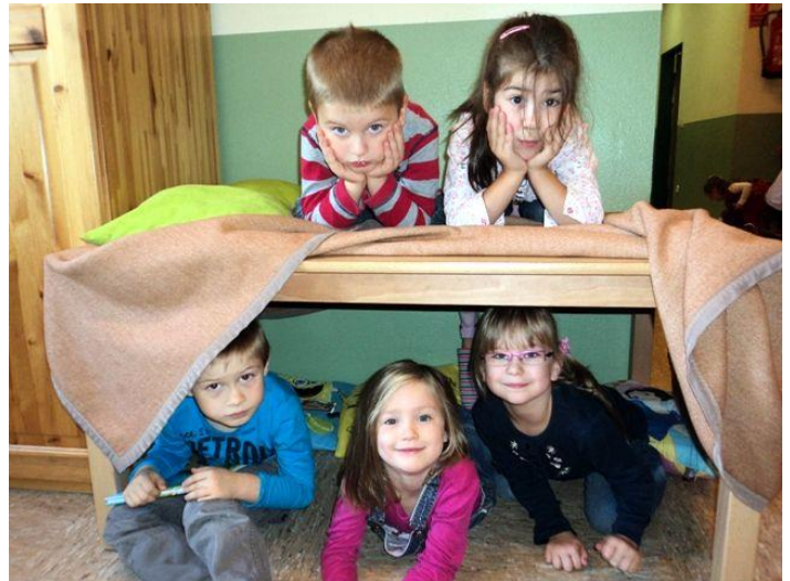
Spielzeug macht Ferien-Tag: Bau einer Kuschelhöhle

Fester Bestandteil des Papilio-Projekts ist unser Spielzeug-macht-Ferien-Tag . Zusammen mit den vier Kobolden wird das herkömmliche Spielzeug an jedem zweiten Freitag in die Ferien geschickt. Dieses feste Ritual bietet Sicherheit und Orientierung. Ohne vorgegebenes Spielzeug festigen die Kinder ihre Fähigkeit, sozial kompetent miteinander umzugehen, ihre Bedürfnisse mit denen der Gruppe abzustimmen. Sie erweitern ihre Kontakte in der Gruppe, entwickeln neue, kreative Spielideen und setzen diese um. Dabei wird auch die sprachliche Ausdrucksfähigkeit erweitert.